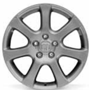
18" Phantom aluminijumski točkovi 7-Spoke - Kaiser Silver nijansa

Hondina originalna dodatna oprema u ponudi ima i impresivan izbor aluminijumskih točkova, dizajniranih posebno za CR-V modele. I nije sve u izgledu, jer, svaki aluminijumski točak je pre toga morao da prođe intenzivna specifična testiranja kako bi se korisnicima obezbedili maksimalna bezbednost, kvalitet i dugotrajnost.