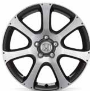
19" Onyx aluminijumski točkovi 7-Spoke - Bright Machined Top Surface Black Pearl nijansa