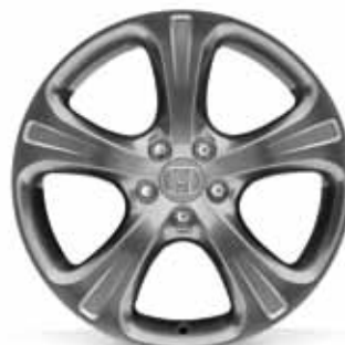
19" Opus aluminijumski točkovi 5-Spoke - Chrome Shadow nijansa